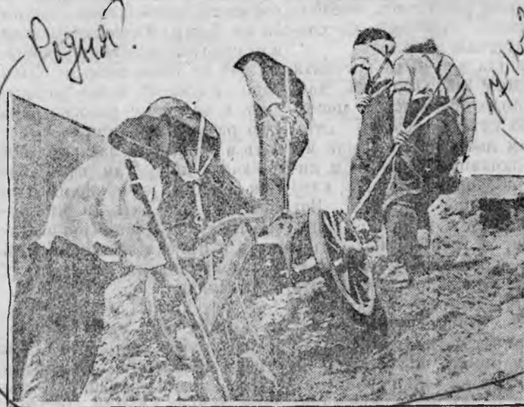
На нашем снимке: крестьяне местечка Матрай (Восточная Тироль Австрия) запрягаясь в плуг по три четыре человека производят запашку своих земельных участков

Обнищание городского и сельского населения в капиталистических странах достигло небывалых размеров